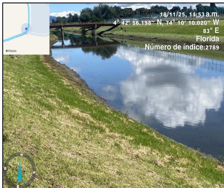
Ilustración 4. Evidencia recorrido punto 3