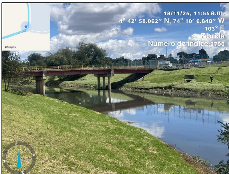
Ilustración 5. Evidencia recorrido punto 4

C.P 250020 Tel. (601) 8234070 823 40 71 / 823 40 73 Fax. (601) 8257620 Dir. Cra. 14 No. 13-05 03-FR-16 VER.11.2025