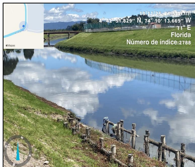
Ilustración 3. Evidencia recorrido punto 2