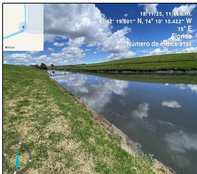
Ilustración 2. Evidencia recorrido punto 1

Dentro del recorrido de control y vigilancia ronda Río Bogotá, no se evidenció presencia de residuos, motobombas, ni semovientes que puedan afectar al ecosistema, ni actividades que alteren el entorno natural o la calidad del agua (ver ilustraciones 2,3,4 y 5).